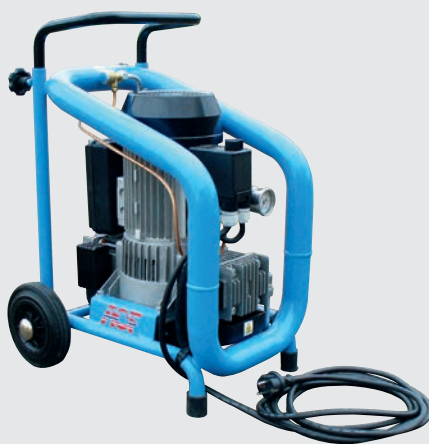
Compressore 200 l/min N 001