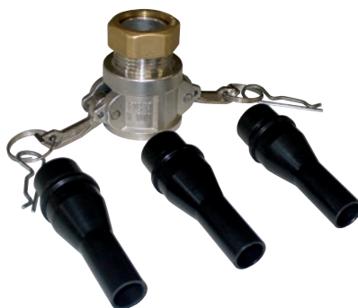
Kit fugatura 1 adattatore + 3 ugelli per la fugatura Ø 10, Ø 12 e Ø 14