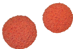
Palline spugna per la pulizia 2 palline spugna per la pulizia P 600