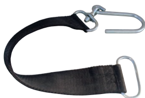
Cinghia portatubo P 603